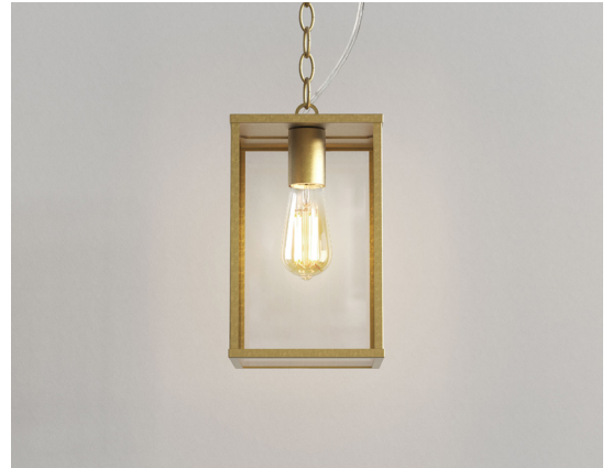
CODE: 1095035 FINISH: NATURAL BRASS

THIS PRODUCT IS SUITABLE FOR USE BY THE COAST AND OTHER ONEROUS ENVIRONMENTS - TEN YEAR WARRANTY APPLIES, EXCEPT WHEN THE PRODUCT HAS AN INTEGRAL LED AND/OR DRIVER IN WHICH CASE, A THREE YEAR WARRANTY APPLIES. FOR FURTHER WARRANTY INFORMATION PLEASE REFER BACK TO THE ORIGINAL POINT OF PURCHASE.